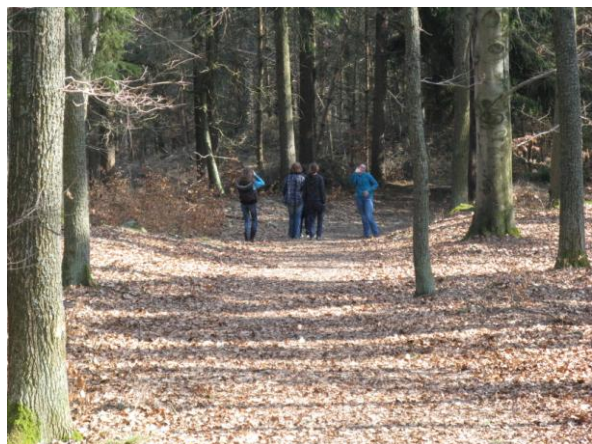
„Děvčata, úsměv a mávat.“