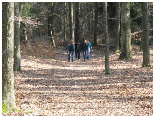
„A znovu nahoru.“