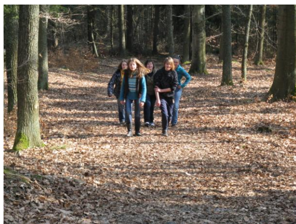
„Tak, konečně jsme nahoře, ale ta cesta se nám vůbec nelíbila...“