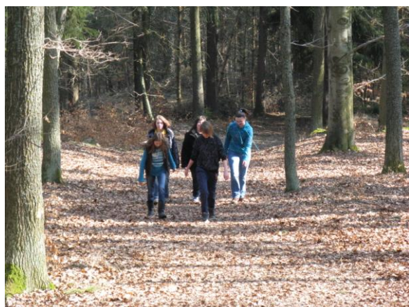
„Bylo nás pět.“