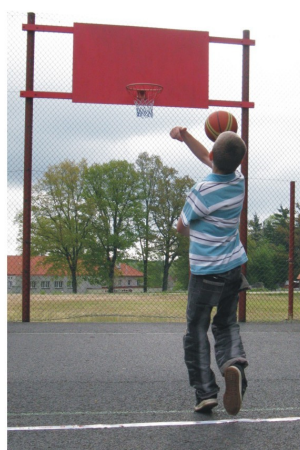
... vši silou odpálit, ...