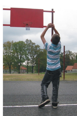
... a pak už se jen modlit!