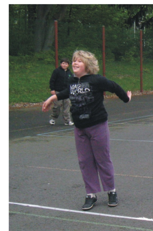
A ta radost, když se trefí!