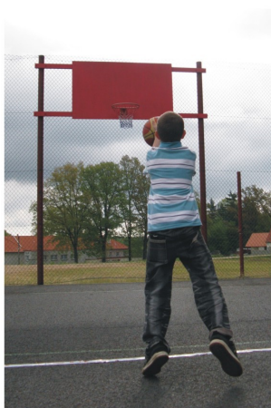
Chce to taktiku! Pořádně zamířit, ...

Hod na čtverec či na koš, veškeré síly tam vlož. Snaž se rychle běžat pro míč, honem, honem, čas už je pryč!