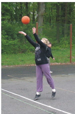
Děvčata na to jdou s větší elegancí, ...