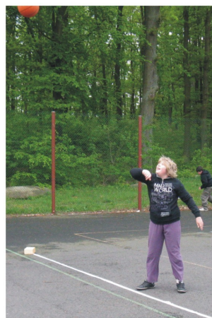
... ale s nemenší silou!