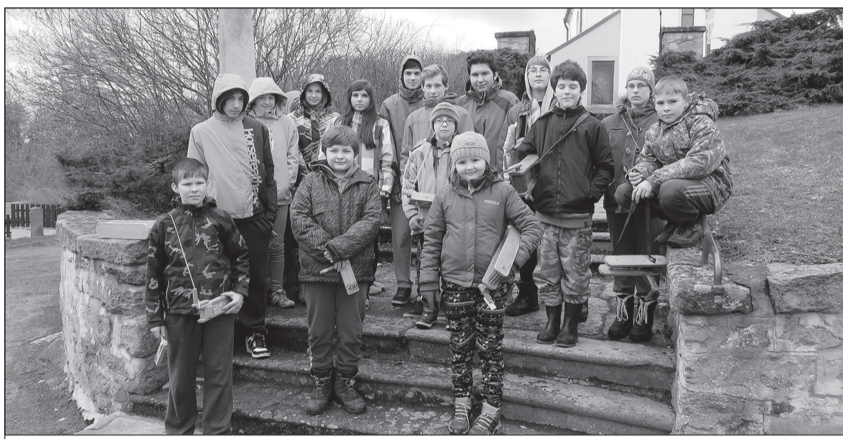
Letošní Velikonoce doprovázelo chladné počasí, přesto děti vytrvale chodily křístat.