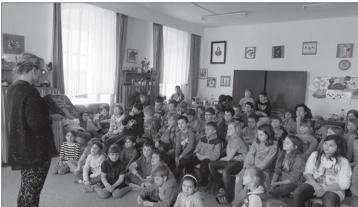
Děti z naší školy pozorně sledují vyprávění spisovatelky a ilustrátorky Renáty Fučíkové.