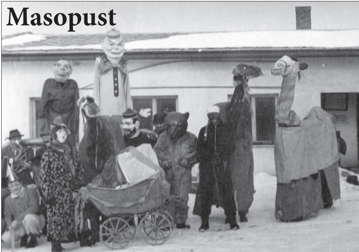
Masopustní obchůzka se koná v Chanovicích pro návaznost na konání našich předků. Starší fotografie je z roku 1965, tehdy se začínalo „na place“. Druhá fotografie je z letošního povolení na návsi „pod kaštanem“. Členové průvodu chtějí hlavně pobavit spoluobčany, kteří o jejich návštěvu stojí. A i pro příští rok platí, připravte si masku a poďte se společně pobavit, zván je každý s dobrou náladou. PKČ