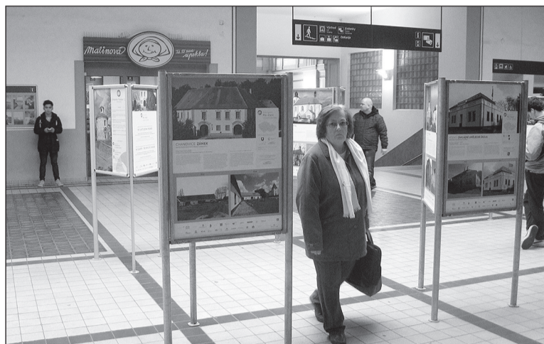
V rámci celorepublikové akce Má vlast se na plzeňském hlavním nádraží vystavovaly fotopanely o naší obci.

NOVINY PRO VENKOV NA POMEZÍ JIŽNÍCH A ZÁPADNÍCH ČECH